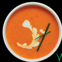
BATATA Y MORRÓN SWEET POTATO & BELL PEPPER