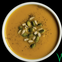
CALABAZA Y JENGIBRE PUMPKIN & GINGER