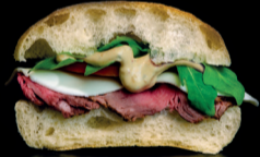
ARGENTINO Roast Beef, Tomato, Mozzarella.