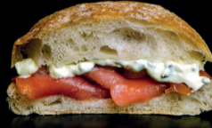
NORUEGO Salmón, queso crema y cebollitas.