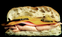
CUBANO Cerdo Asado, cheddar, pepinillos.