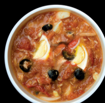
MOJE MURCIANO Tomato, Egg and Tuna.