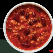
CHILE CON CARNE VEGAN BEEF CHILI