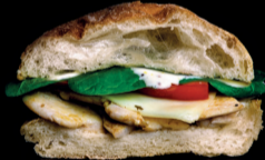
GRANJERO Pechuga de pollo, espinacas, queso emmental.