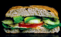
VEGANO Aguacate, Hummus, Espinacas.