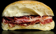
ESPAÑOL Paleta Ibérica y tomate.