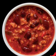
CHILI CON CARNE BEEF CHILI