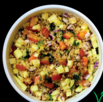
QUINOA Quinoa Salad.