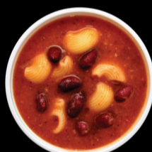
GUISO ITALIANO ITALIAN STEW