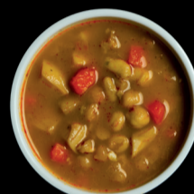
SEPIA Y GARBANZOS CHICKPEAS & CUTTLEFISH