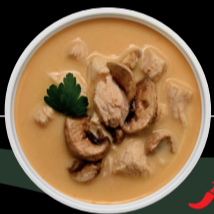
SOPA THAI VEGAN THAI SOUP