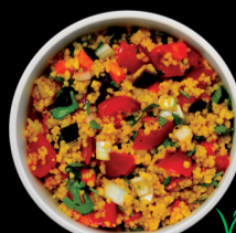
TABULÉ Cous-Cous Salad.