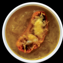
CEBOLLA ONION SOUP