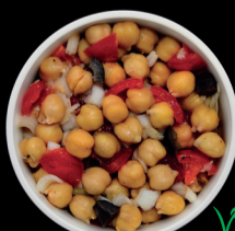
GARBANZOS Chickpeas Salad.