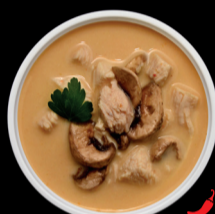
SOPA THAI THAI SOUP